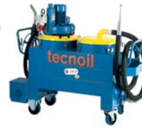
TECNOIL 250 T3 250 MP