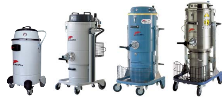
MISTRAL 501 WD AIR