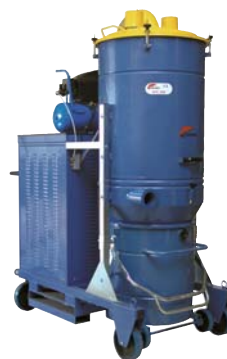
DG 200 / 300 HD