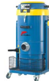
DM 35 SGA DM 40 SGA