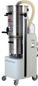
MISTRAL 20/30 PHARMA