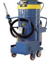
TECNOIL 150 MP