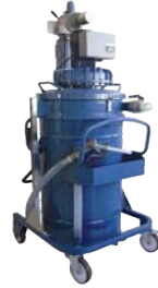
TECNOIL 151 T3