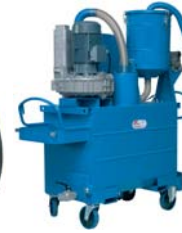
TECNOIL 700 T110 450 T55