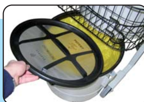
Verschließbarer Einwegbeutel für gefährliche Stäube