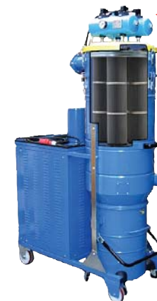
DG 150 PN