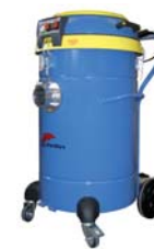
DM 35 WD