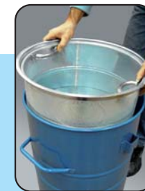
Spänekorb und Ablassventil