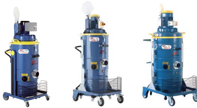
DM 30 ECO