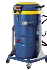
DM 35 OIL DM 40 OIL