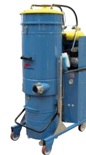
DG 70 EXPORT PN